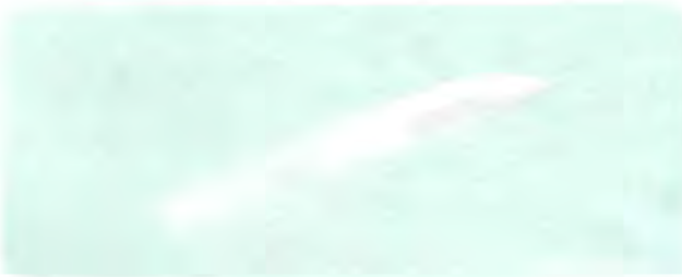
END FORMING ILLUSTRATION See page 24